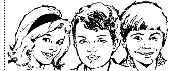
Mládežnícke okienko :-)